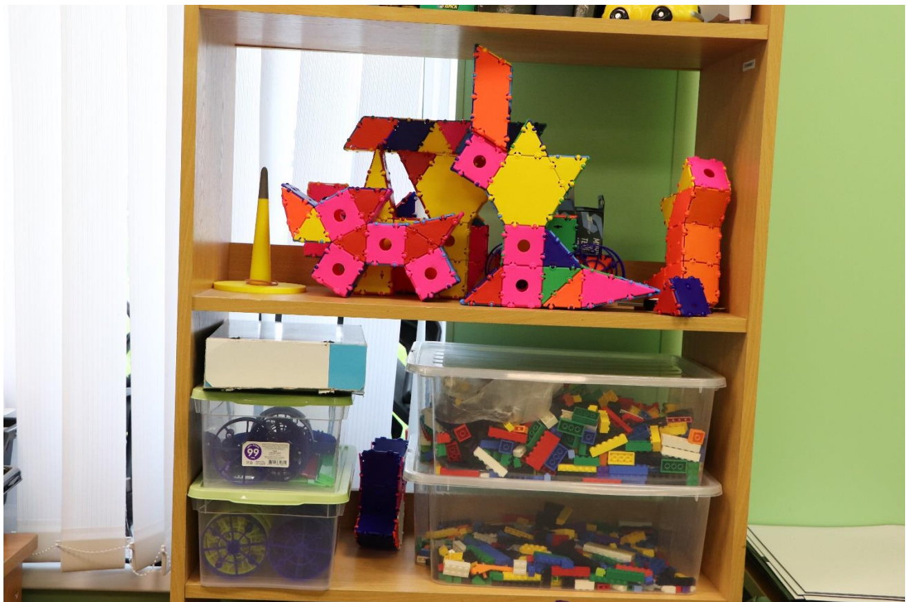
Лего-кирпичики и ТИКО конструктор