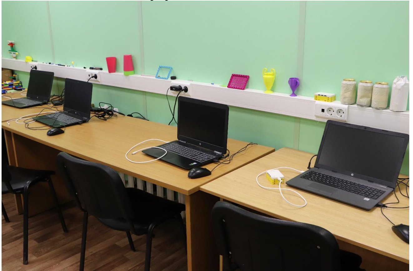
Рабочее место обучающихся