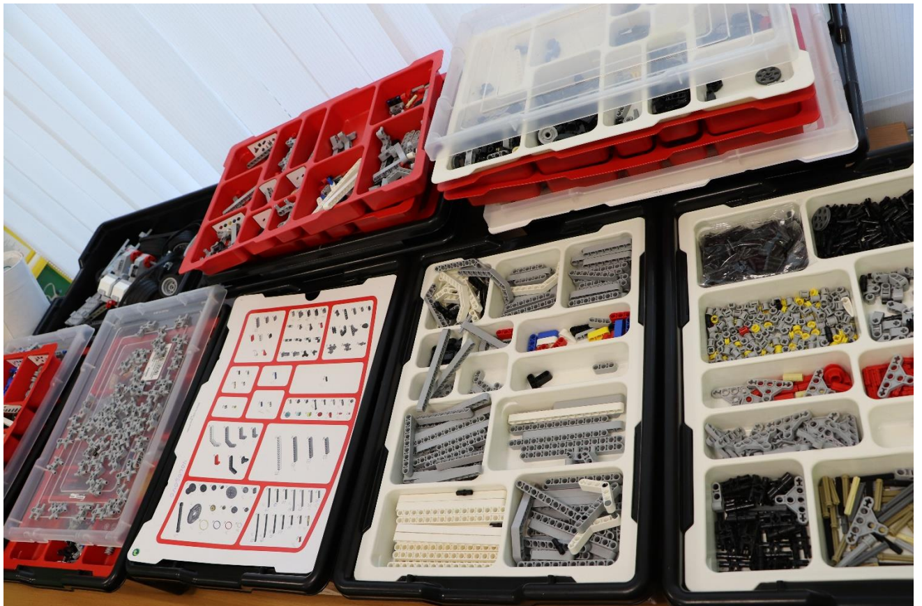
Наборы Lego EV3