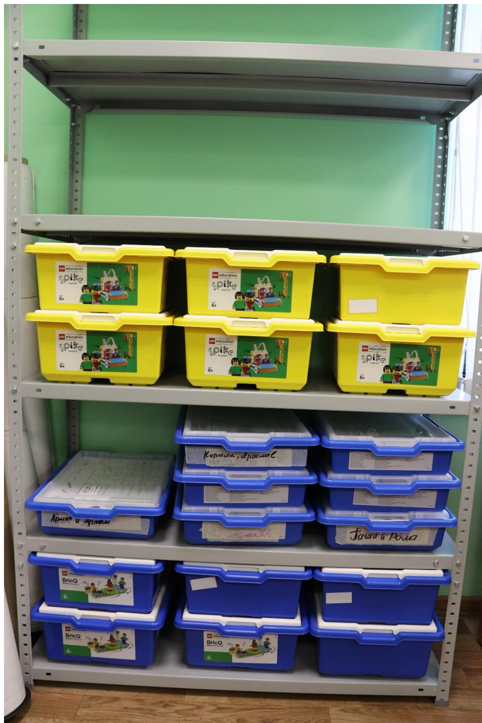
Наборы Lego для робототехники: Первые механизмы, WeDo 2.0, Prime start