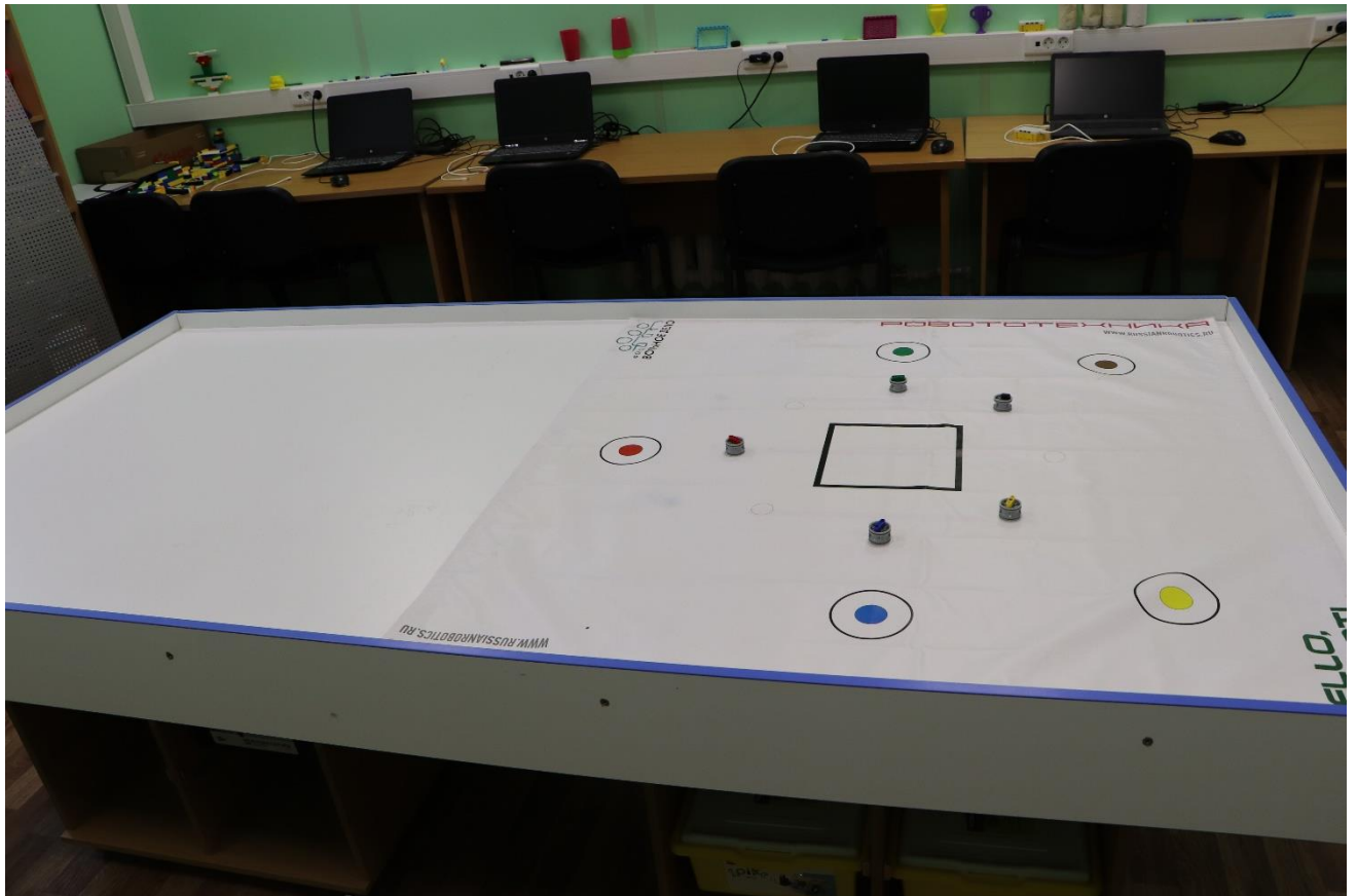
Стол и поля для робототехники