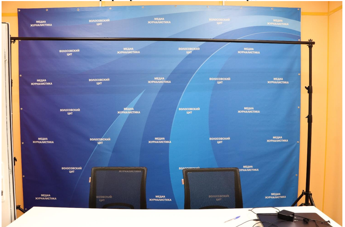
Зона хромокея и фона