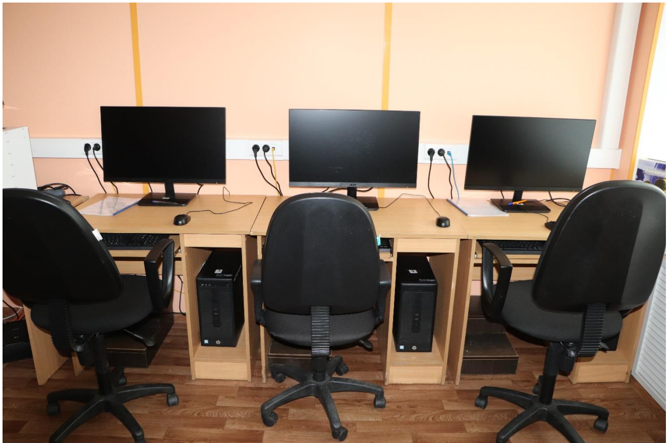
Рабочее место обучающихся