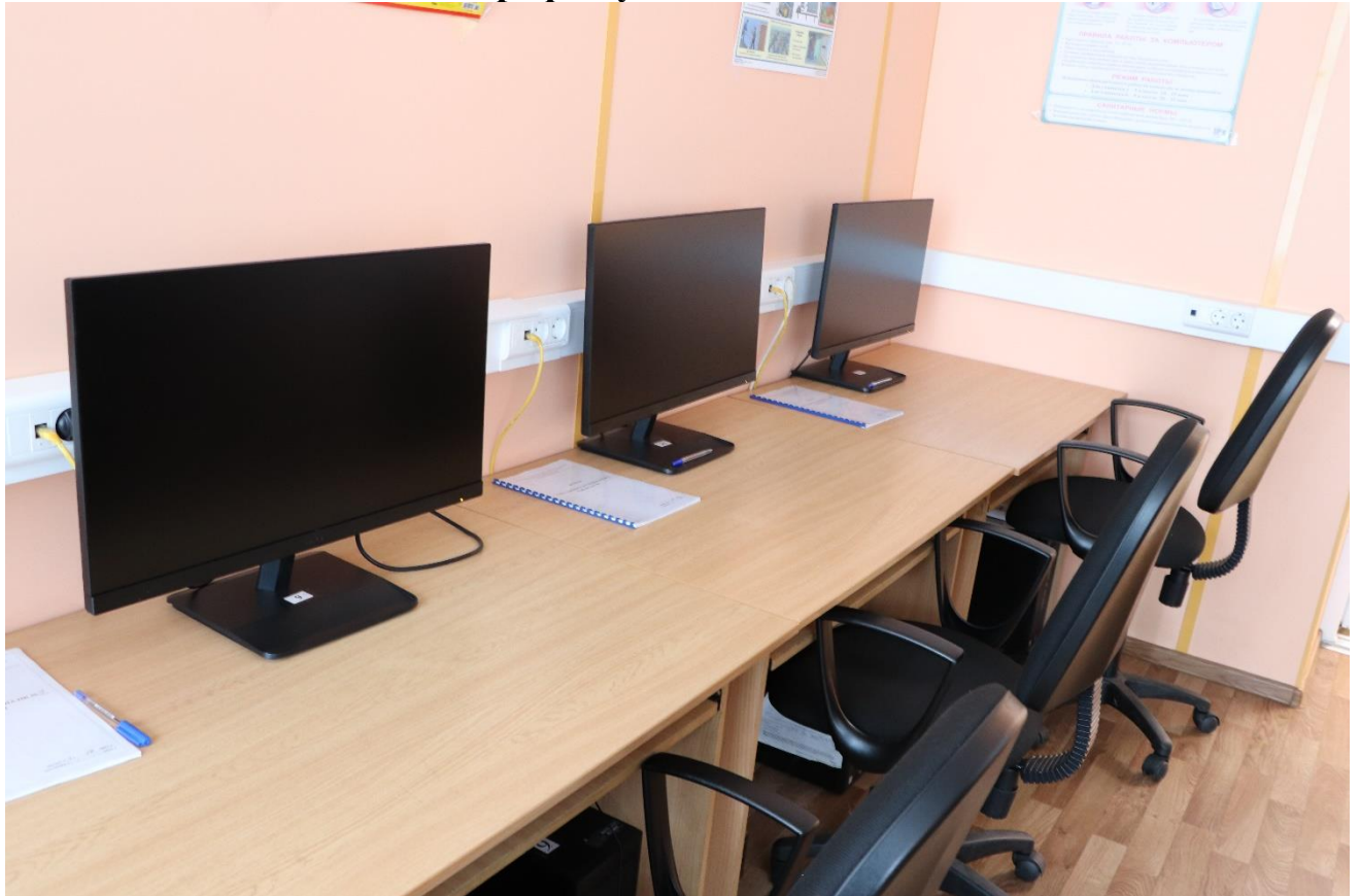
Рабочее место обучающихся